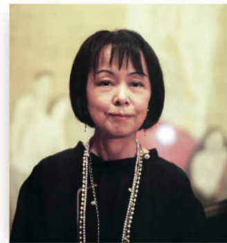
Mihoko SUÉYASU (Poète japonaise -Tanka, Peintre)